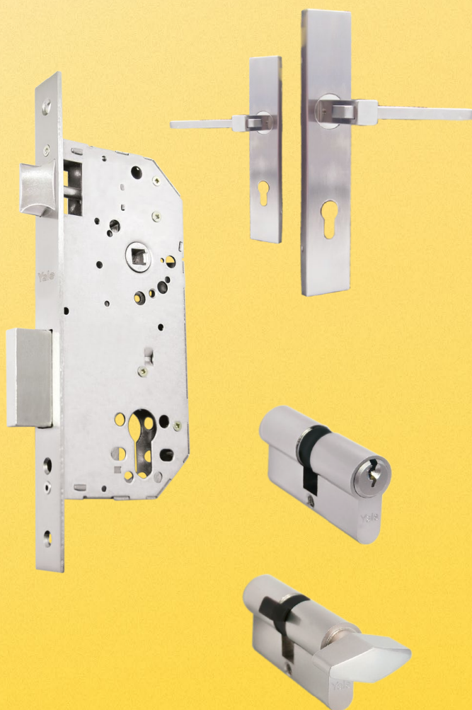
Cilindro llave-llave o llave-mariposa