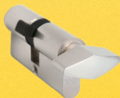
Cilindro llave-llave o llave-mariposa